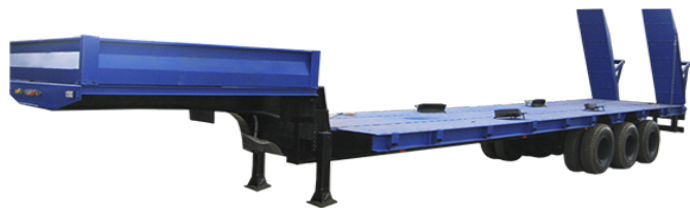
Технические характеристики 935911