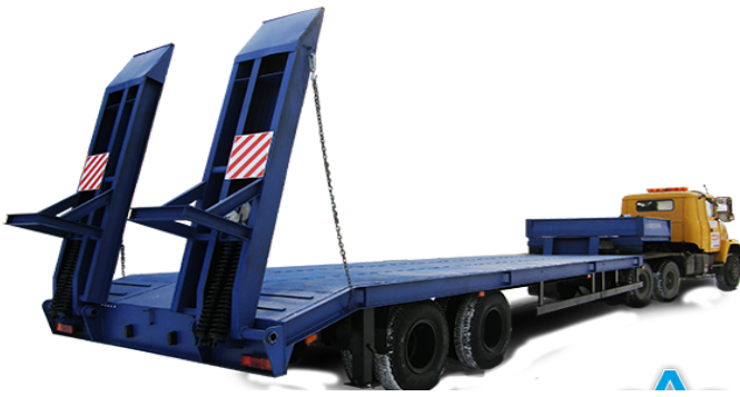
Технические характеристики 935912